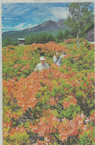
AR (14) レンゲツツジ見事